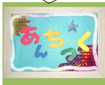
ルール考案者: あんちっく