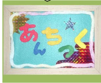
ルール考案者: あんちっく